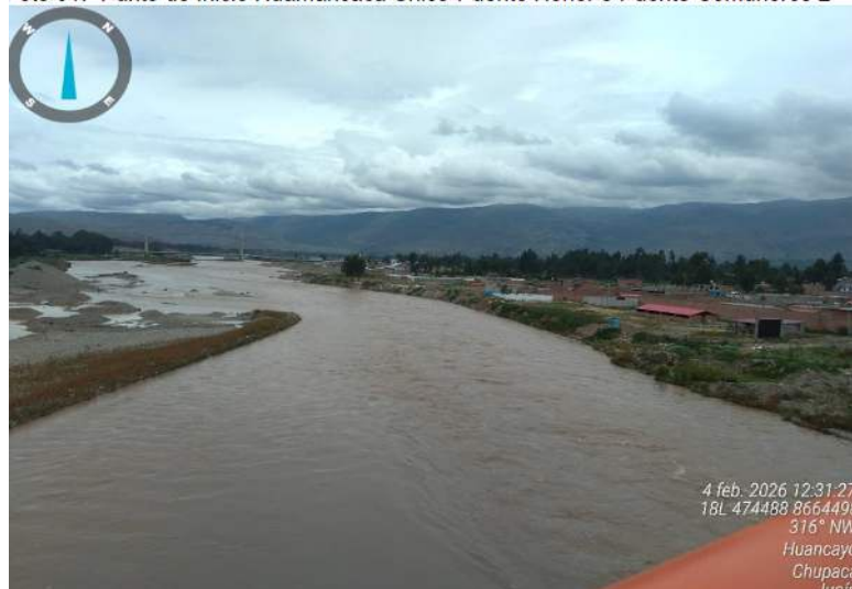
Foto 01.- Punto de Inicio Huamancaca Chico-Puente Horler o Puente Comuneros 2